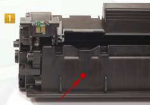
TROU DE REMPLISSAGE